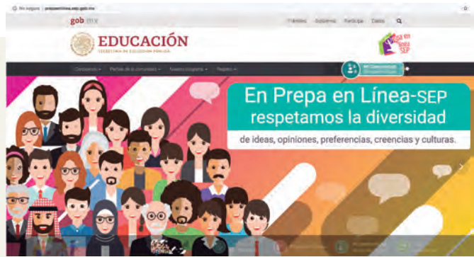
Prepa en Línea-SEP, "Registro de aspirantes".

La convocatoria de Prepa en Línea-SEP se dirige tanto a jóvenes recién egresados de secundaria como a cualquier mexicano, sin importar su lugar de residencia, que deseen realizar sus estudios de bachillerato y cuenten con certificado de secundaria.