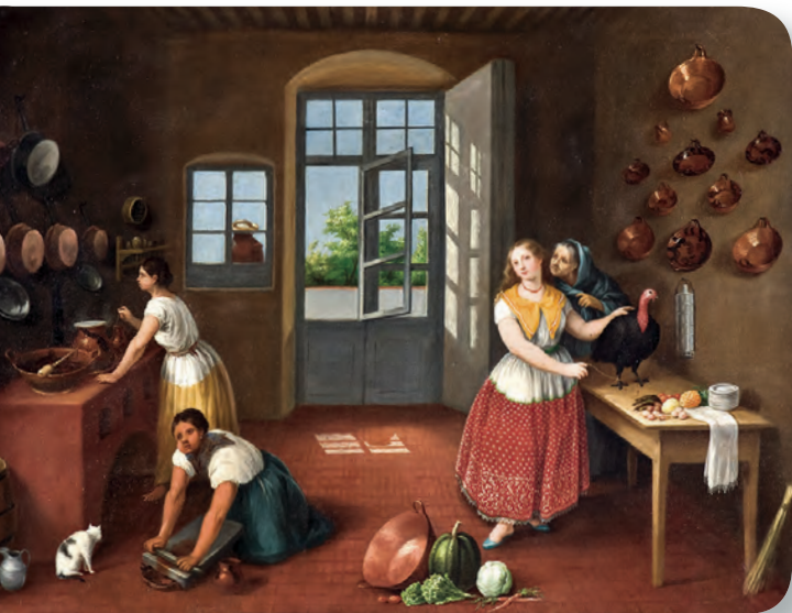
Figura 1.57 Agustín Arrieta se caracterizó por pintar escenas de la vida cotidiana de la región de Puebla y cuadros en los que se muestra la rica tradición culinaria mexicana. Cocina poblana , Agustín Arrieta (1865).