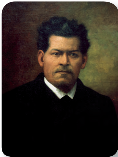
Figura 1.55 Ignacio Manuel Altamirano, político liberal, participó en la Revolución de Ayutla, la Guerra de Reforma y combatió contra la Segunda Intervención Francesa. Publicó varias novelas costumbristas. Ignacio Manuel Altamirano , Santiago Rebull (1870).

Durante la República restaurada (1867-1876), fueron abiertas escuelas primarias y secundarias para niñas y jovencitas, donde les impartían cursos de artes y oficios. Pronto ellas se integraron al mundo profesional como maestras, enfermeras y auxiliares de contaduría.