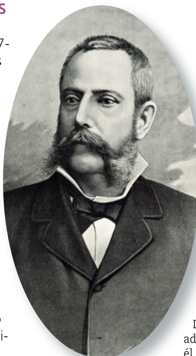
Figura 1.53 Gabino Barreda fue maestro, médico, filósofo y político. Organizó y dio vida al primer “proyecto moderno” de educación media en México. Los institutos estatales se adhirieron al programa ideado por él para la ENP. Dr. D. Gabino Barreda.