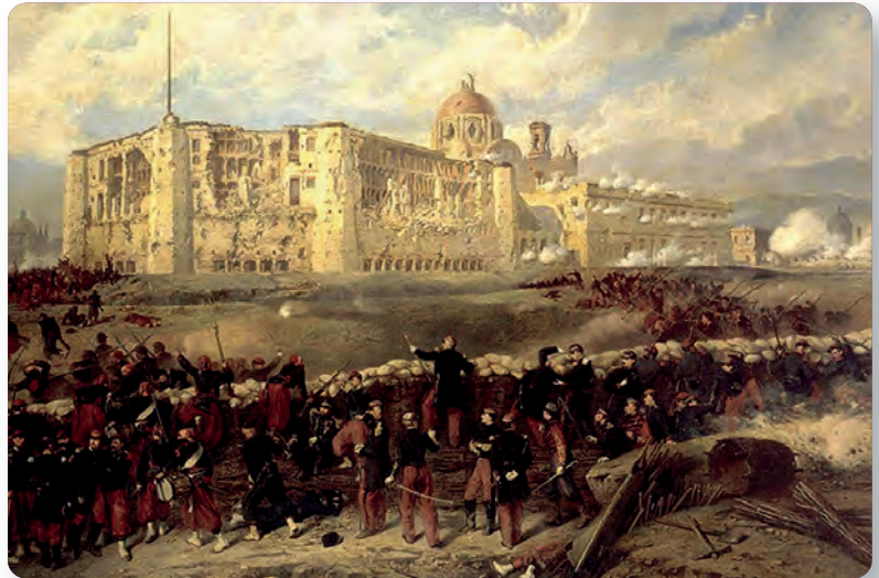
Figura 1.41 Benito Juárez encomendó la defensa de Puebla al general Jesús González Ortega. Después de dos meses de sitio, bombardeos y combates, los liberales mexicanos perdieron la ciudad. Asedio de Puebla, tomado del Fuerte San Xavier, 29 de marzo de 1863, Jean-Adolphe Beaucé (1867).

La toma de la Ciudad de México no significó el fin de la guerra. Las tropas invasoras al mando del general Forey lograron ocupar las principales ciudades del centro, occidente y oriente del país entre octubre de 1863 y febrero de 1864, como Querétaro, Morelia, Guanajuato, Guadalajara, San Luis Potosí, Aguascalientes y Zacatecas. También emprendieron campañas hacia el norte hasta alcanzar la frontera, mientras que algunos gobernadores, como los de Nuevo León y Yucatán, se sumaron a los invasores.