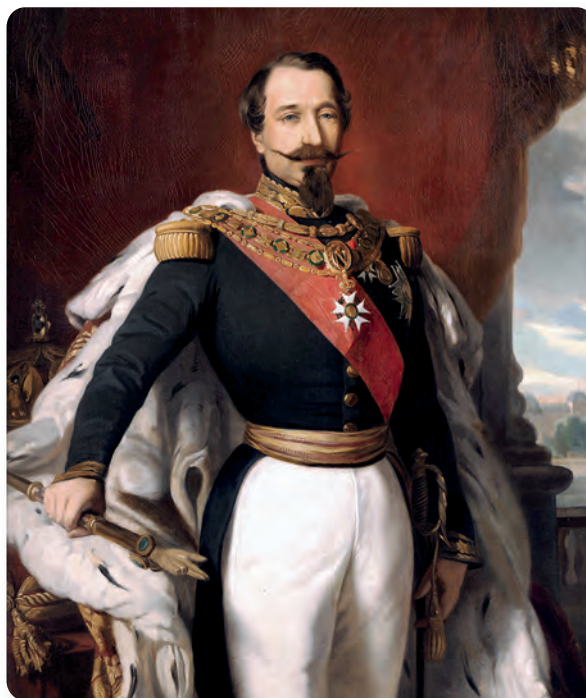
Figura 1.38 Napoleón III quería ampliar las posesiones francesas en América, reducidas drásticamente desde que Napoleón Bonaparte vendió el territorio de la Luisiana a Estados Unidos. El emperador Napoleón III, del taller de Franz Xaver Winterhalter (1853).

Los conservadores mexicanos José María Gutiérrez de Estrada, José Manuel Hidalgo y Juan Nepomuceno Almonte promovieron durante años en Europa que México se convirtiera en una monarquía con un príncipe europeo. Sus peticiones fueron escuchadas por Napoleón III, quien quería expandir su imperio.