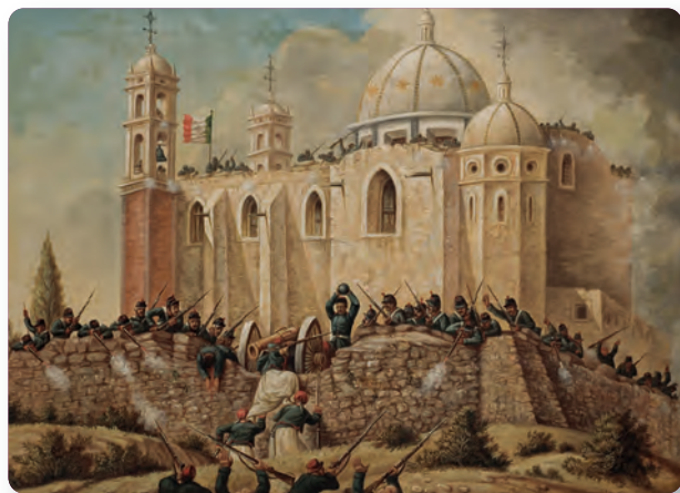
Figura 1.40 “Nuestros enemigos son los primeros soldados del mundo, pero vosotros sois los primeros hijos de México y os quieren arrebatar vuestra patria”, Ignacio Zaragoza. Batalla de Puebla, Patricio Ramos Ortega (1862).

El 5 de mayo de 1862, el general Zaragoza enfrentó al ejército imperial de Napoleón III, compuesto por franceses, egipcios, zuavos , polacos, entre otros, en la ciudad de Puebla. En este enfrentamiento, conocido como la Batalla de Puebla (figura 1.40), el ejército mexicano derrotó a las fuerzas expedicionarias, las cuales regresaron a Orizaba con muchas bajas.