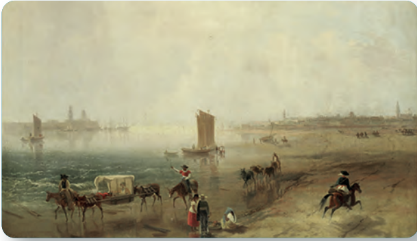
Figura 1.1 La riqueza del puerto de Veracruz durante el siglo XIX se debió a su activo comercio y a que fue la puerta de entrada a nuestro país. También fue el punto de partida para la mayoría de las intervenciones extranjeras. Vera Cruz, y el Castillo de San Juan de Ulúa , Daniel Thomas Egerton (1830).