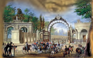
Entrada triunfante de Iturbide en México con el Ejército Trigarante el 27 de septiembre de 1821.