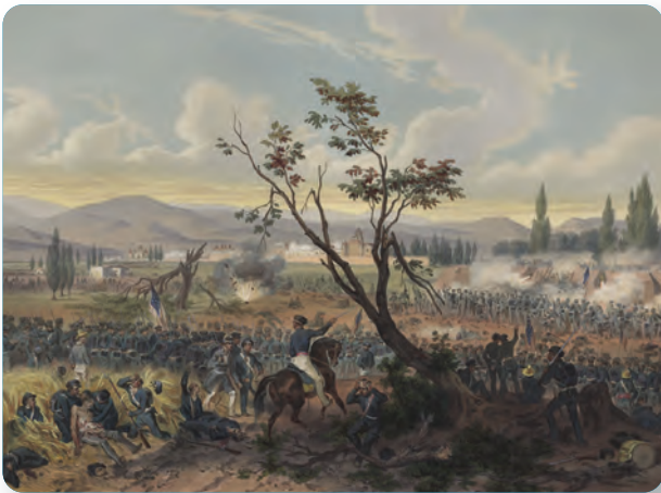
Figura 1.2 Ataque a Churubusco por la división del general Worth el 20 de agosto de 1847, testimonio de la guerra de Intervención norteamericana en nuestro país. Batalla de Churubusco , Carl Nebel.