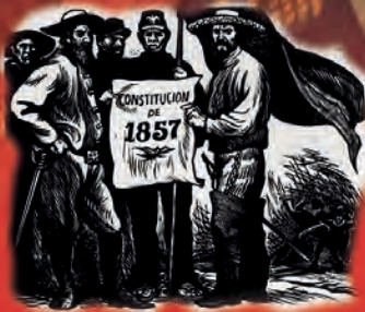
Constitución de 1857.

Debido a la promulgación de la Constitución de 1857 , estalló una guerra civil entre liberales y conservadores: la Guerra de Reforma o de los Tres Años ( 1858-1861 ).