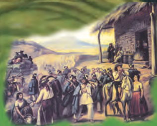
Soldados de la Reforma en una venta.

En 1861 , el gobierno liberal de Benito Juárez suspendió los pagos de la deuda externa, hecho que propició la segunda intervención armada de Francia y la imposición de un gobierno monárquico. Con el triunfo liberal en 1867 , se consolidaron la república, la soberanía y la independencia. Los siguientes diez años se conocen como República restaurada.