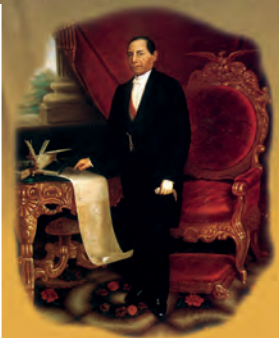
Retrato de Benito Juárez.

Epopeya del pueblo mexicano o Historia de México a través de los siglos.