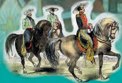
General Antonio López de Santa Anna en uniforme militar.