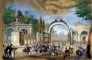
Entrada triunfante de Iturbide en México con el Ejército Trigarante el 27 de septiembre de 1821.