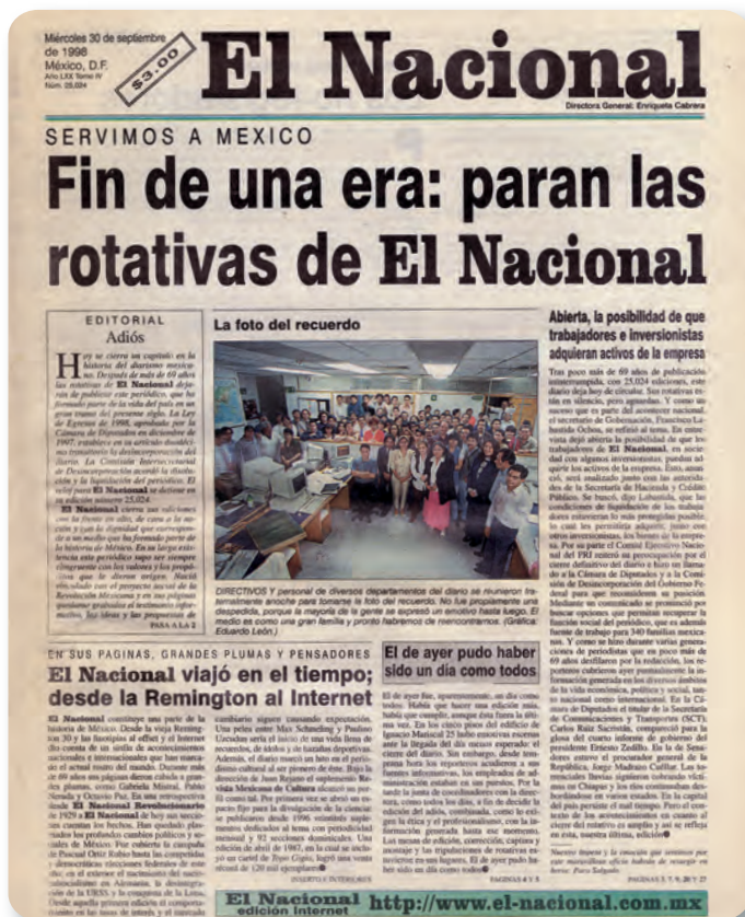
Figura 3.19 El Nacional fue el periódico oficial del gobierno mexicano, fundado en 1929. Dependía de la Secretaría de Gobernación. Portada de El Nacional , miércoles 30 de septiembre de 1998.

Para conocer los principios que caracterizan a los gobiernos democráticos, consulta tu libro de Formación Cívica y Ética.