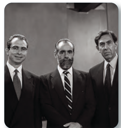
Figura 3.18 En 1994, se celebró el primer debate presidencial en México. En la imagen, los candidatos Ernesto Zedillo, Diego Fernández de Ceballos y Cuauhtémoc Cárdenas. Debate electoral (1994).

En las elecciones presidenciales del año 2000, el PRI postuló a Francisco Labastida; el Partido de la Revolución Democrática (PRD), al entonces jefe de gobierno del Distrito Federal, Cuauhtémoc Cárdenas, y el PAN, a Vicente Fox, quien resultó vencedor. Con estos comicios terminaron setenta años de gobierno del partido hegemónico. Por primera vez en su historia, el PRI perdía la presidencia de la República.