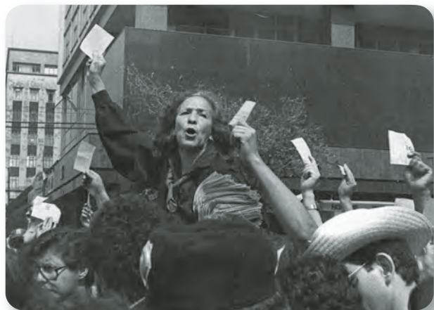
Figura 3.16 Con una destacada trayectoria como luchadora social a favor de los desaparecidos y víctimas de la guerra sucia, Rosario Ibarra fue la primera candidata a la presidencia de la República en 1982 por el PRT. Participación de Rosario Ibarra en una manifestación rumbo al Zócalo Capitalino (1989).

La LOPPE permitió la formación de nuevos partidos políticos. A partir de 1982, además de los que ya existían, como el PRI, el PAN, el Partido Auténtico de la Revolución Mexicana (PARM) y el Partido Popular Socialista (PPS), se registraron, entre otros, el Partido Socialista Unificado de México (PSUM), el Partido Demócrata Mexicano (PDM) y el Partido Revolucionario de los Trabajadores (PRT) (figura 3.16).