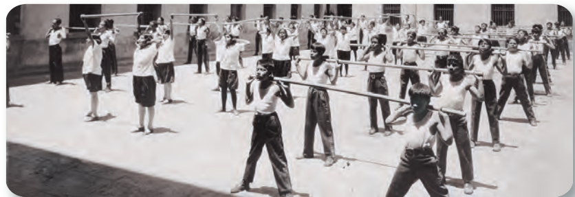
Figura 2.45 La educación física fue importante para la educación socialista; tenía el objetivo de fortalecer física y espiritualmente a los estudiantes y fomentar la vida saludable. Niños en clase de educación física (ca. 1940).

Muchos niños y adolescentes trabajaban en las calles como papeleros , es decir, voceaban el nombre de los periódicos para venderlos. En 1941, alrededor de 90% de los 1500 papeleros de la Ciudad de México tenía menos de dieciocho años. Si bien había algunas niñas vendedoras de periódicos, la mayoría de estos voceadores eran hombres.