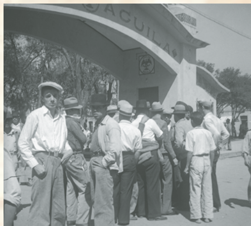
En 1938, la gran mayoría de las empresas petroleras eran de origen extranjero; entre las más importantes estaban la compañía inglesa El Águila y La Huasteca Petroleum de origen estadounidense. Trabajadores petroleros afuera de la compañía El Águila (1936).

En el periodo cardenista se expropiaron empresas extranjeras: se nacionalizaron los ferrocarriles (23 de junio de 1937) y la industria petrolera (18 de marzo de 1938); además, el Estado comenzó a tomar un papel activo en la regulación y fomento de la actividad económica nacional.