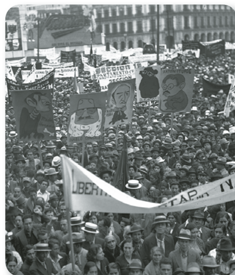
Figura 2.44 Trabajadores, estudiantes, intelectuales, amas de casa y campesinos se manifestaron para apoyar la expropiación petrolera. Mitin obrero-estudiantil por la expropiación de la industria petrolera (1938).