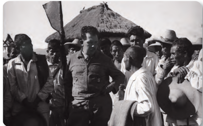
Figura 2.42 Una modalidad del reparto agrario cardenista fue la formación de grandes ejidos colectivos, como ocurrió en la Comarca Lagunera. Lázaro Cárdenas dialoga con campesinos en el campo (ca. 1940).

En 1935, se fundó el Frente Único Pro Derechos de la Mujer, el cual agrupó aproximadamente a 50 mil mujeres de todas las clases sociales y de diferentes zonas del país. Su objetivo era lograr la plena ciudadanía para las mujeres. En 1937, hubo una iniciativa de reforma para permitir el voto de las mujeres, pero ésta finalmente no prosperó.