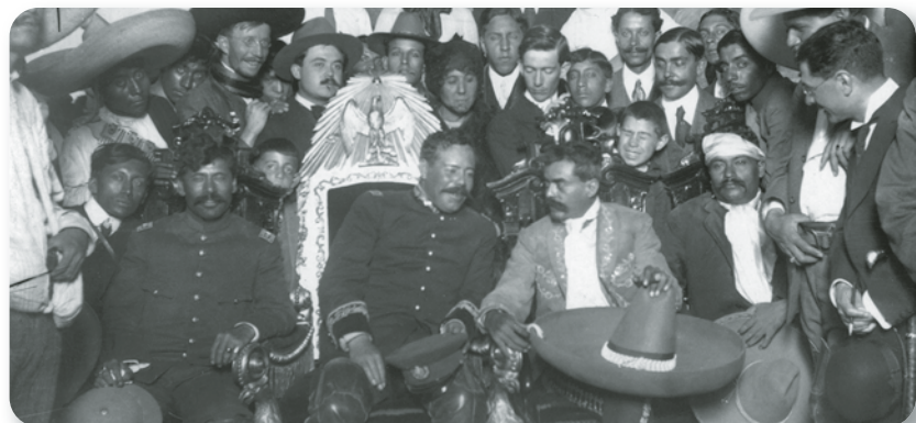
Figura 2.26 El presidente provisional convencionista Eulalio Gutiérrez no pudo gobernar bajo la sombra de Francisco Villa (el Centauro del Norte) y Emiliano Zapata (el Caudillo del Sur). Francisco Villa en la silla presidencial (1914).

Los convencionistas (villistas y zapatistas) entraron a la capital en diciembre de 1914 (figura 2.26).