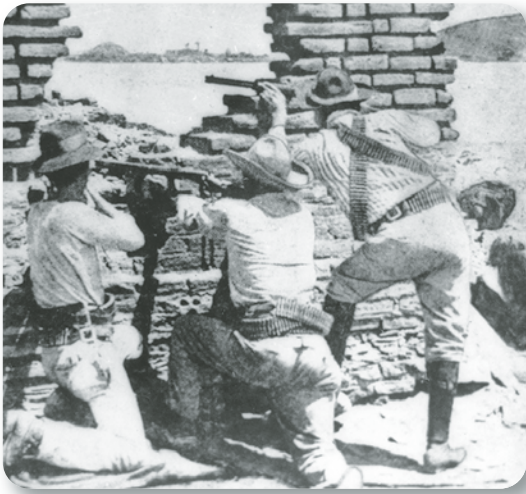
Figura 2.25 La Revolución Mexicana fue un movimiento de masas en el que, en distintas fases, todos los sectores sociales intervinieron de una u otra forma. El pueblo la llamó la Bola. Revolucionarios durante combate se resguardan detrás de un muro (1914).

El gobierno de Huerta duró poco más de un año. Las fuerzas revolucionarias lograron derrotar al ejército federal en numerosas batallas y regiones (figura 2.25). A esto se sumó que el nuevo presidente de Estados Unidos, Woodrow Wilson, desconociera el gobierno de Huerta y ordenara la ocupación del puerto de Veracruz el 21 de abril de 1914.