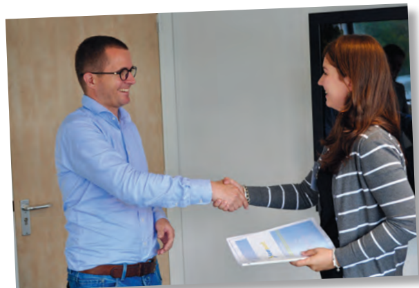
Las autoridades están obligadas a atender oportunamente las peticiones y demandas concretas de los ciudadanos.

Dentro del territorio del Estado mexicano operan tres niveles de gobierno: federal, estatal y municipal. Esta organización se llama federalismo y su propósito es, por un lado, distribuir las tareas para dar un mejor servicio a los ciudadanos y, por otro, proteger la soberanía y la libertad de estados y municipios frente al poder federal.