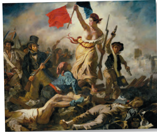
El pueblo ha logrado el reconocimiento de su soberanía después de largas luchas históricas. La Libertad guiando al pueblo , de Eugène Delacroix.