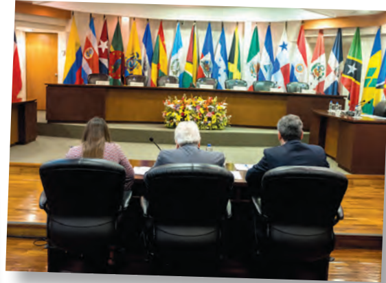
La CIDH, órgano autónomo, protege los derechos humanos en el continente americano. En 2018 condenó a México por un caso de agresión a mujeres.

Existe un sistema mundial o universal de protección de los derechos humanos, el cual está encabezado por la ONU. Dentro de esta organización hay mecanismos específicos, como el Alto Comisionado para los Derechos Humanos, cuya función es promover y proteger los derechos de todas las personas, y el Tribunal Penal Internacional, encargado de juzgar casos de genocidio y crímenes de guerra.