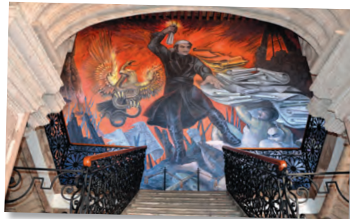
Ante el Congreso de Anáhuac, Morelos presentó un documento precursor de nuestra Constitución: Sentimientos de la Nación , en 1813. Morelos y la justicia , de Agustín Cárdenas.

En nuestro país, tanto la Constitución como las demás leyes se ponen por escrito y se divulgan para que los ciudadanos las conozcan y tengan una mayor claridad o certidumbre sobre el contenido de sus artículos.