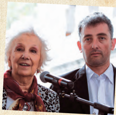
Estela de Carlotto, presidenta de la organización Abuelas de Plaza de Mayo, quien en 2014 encontró por fin a su nieto.

Durante la dictadura militar en Argentina (1976-1983), cientos de personas opositoras al gobierno fueron detenidas y desaparecidas. En muchos casos eran mujeres embarazadas que tuvieron a sus bebés en cautiverio. Éstos les fueron arrebatados y entregados secretamente en adopción. De la mayoría de las madres y padres no se supo más, y los bebés crecieron sin saber su origen. Desde entonces, las abuelas de aquellos bebés luchan sin descanso para encontrar a cada nieto perdido y que sepan la verdad de su origen. Son las Abuelas de Plaza de Mayo, que hasta 2019 habían encontrado a ciento treinta nietos y enviado a juicio a muchos responsables.