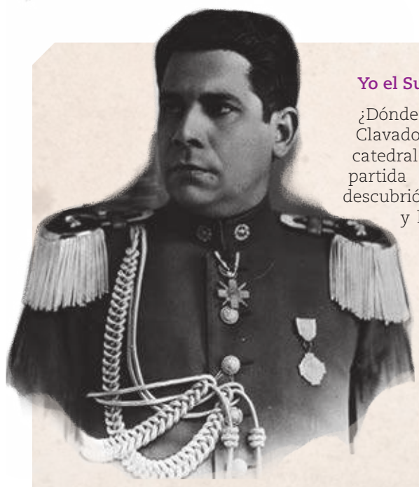
Higinio Morínigo, militar que gobernó Paraguay entre 1940 y 1948.