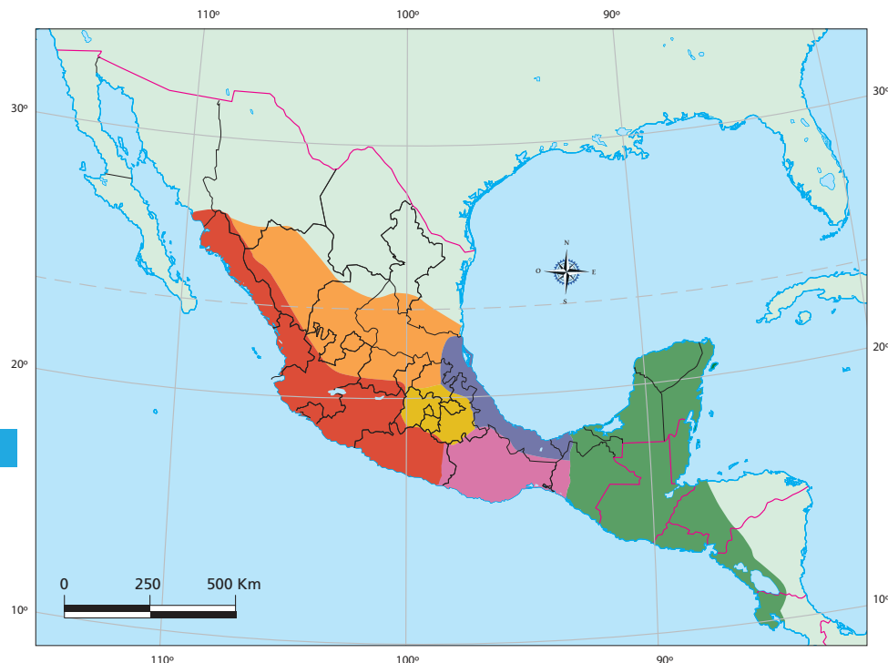
Mapa 1.6 Áreas culturales de Mesoamérica