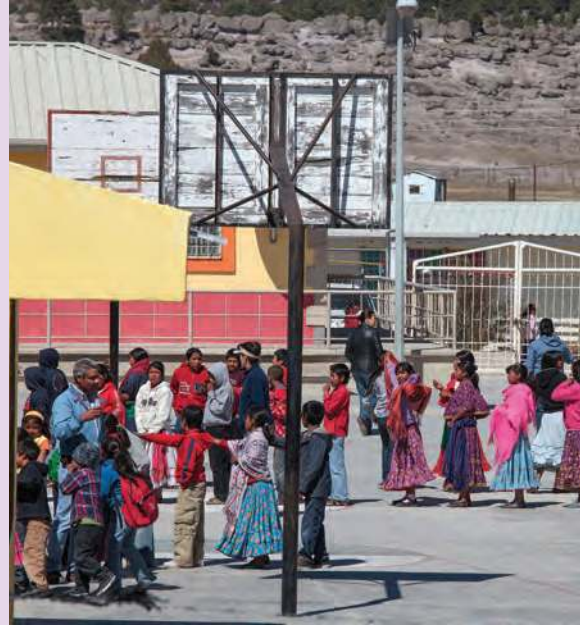
Según datos del Instituto Nacional de Estadística y Geografía (Inegi), en 2017, sólo 24.2% de los jóvenes hablantes de lenguas indígenas de 15 a 24 años asistía a la escuela.