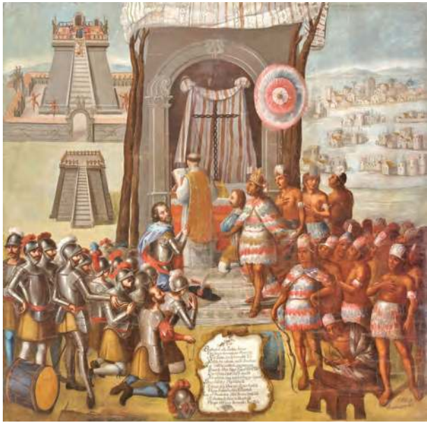
Figura 1.1 El dominio español implicó un cambio de religión en los pueblos originarios. En cada territorio conquistado, Hernán Cortés mandaba que se celebrara una misa, que se retiraran los dioses prehispánicos y en su lugar se colocaba una cruz. La consagración de los templos paganos y la primera misa en México-Tenochtitlan. José Vivar y Valderrama (1752).