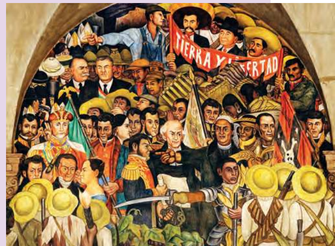
Parte central del mural La historia de México o Epopeya del pueblo mexicano . Diego Rivera (1929-1935).