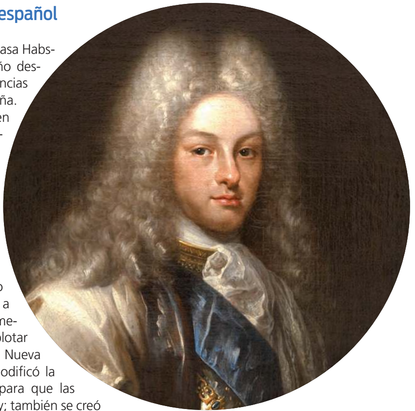
Figura 3.1 El primer rey de la Casa Borbón en España fue Felipe, duque de Anjou, nieto de Luis XIV de Francia, quien fue reconocido en el trono español tras vencer al candidato de los Habsburgo, Carlos, archiduque de Austria. Felipe V. Miguel Jacinto Meléndez (1718-1722).

Con esas acciones se pretendía centralizar el poder en manos del monarca. Las reformas borbónicas se aplicaron con mayor fuerza durante la segunda parte del siglo XVIII.