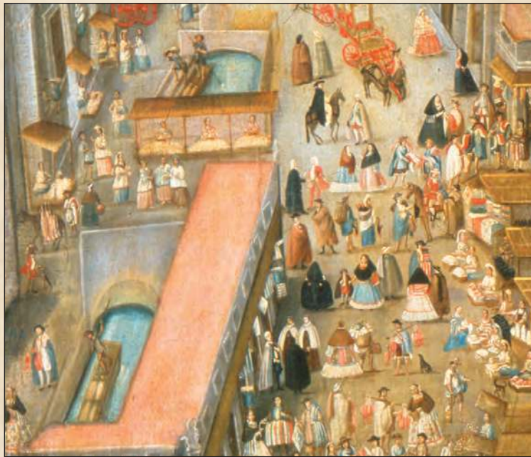
La Plaza Mayor de México en el siglo XVIII (detalle). Museo Nacional de Historia.

1. En equipo, observen con detenimiento la escena anterior y completen la tabla.