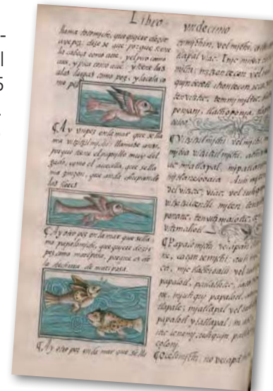
Figura 2.63 Peces representados en el Códice florentino. Esta magna obra consta de 12 libros dedicados a diferentes temas, entre los cuales destaca el libro xi, el cual es un tratado de historia natural. Códice florentino, fray Bernardino de Sahagún (siglo xvi).