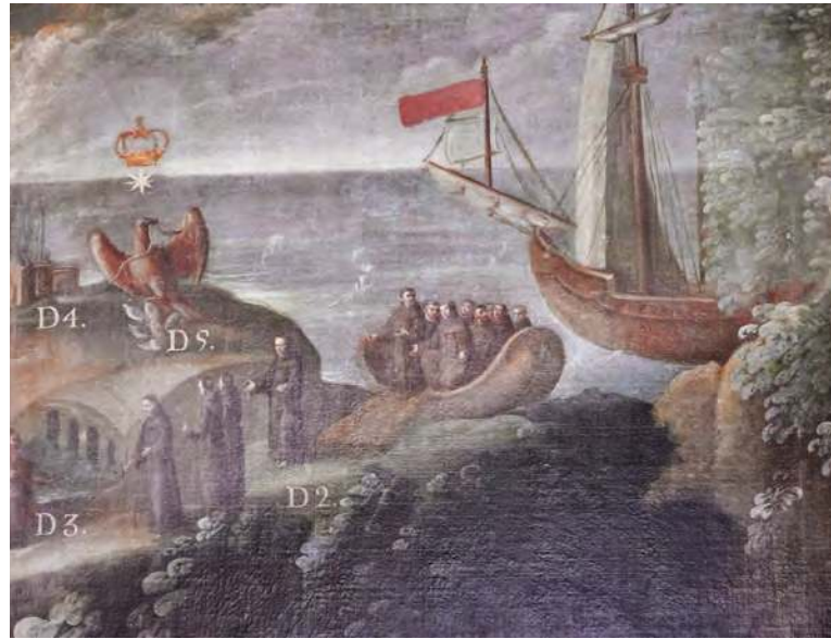
Figura 2.46 La orden de San Francisco, fundada en el siglo XIII por Francisco de Asís, defendió los principios cristianos de pobreza y caridad. Llegada de los franciscanos a Veracruz (detalle). Anónimo, siglo XVII.

Los franciscanos extendieron su presencia en el centro de la Nueva España, así como en los actuales estados de Michoacán, Jalisco y Zacatecas; posteriormente se establecieron desde San Luis Potosí y la Sierra Gorda de Querétaro hasta Texas. Los dominicos fueron la segunda orden en llegar (1526) y se ubicaron en las regiones del sur, desde Oaxaca hasta Guatemala. Los agustinos (1533) se enfocaron en aquellas regiones no ocupadas por las otras órdenes religiosas, como el Occidente, las huastecas y el Pánuco. Tiempo después, los jesuitas (1572) se dedicaron a establecer colegios en muchas ciudades y un sistema de misiones en las regiones más alejadas del noroeste.