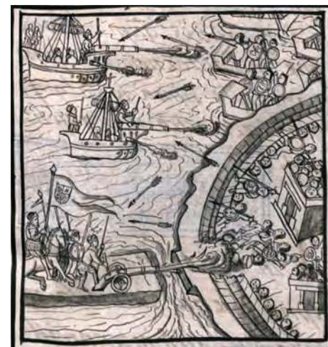
Figura 2.36 Los bergantines de los españoles y sus cañones les permitieron tener control total del lago de Texcoco. Códice florentino (siglo XVI).

Tras ganar las calzadas, el ejército conquistador entró en la ciudad y atacó el Templo Mayor. A pesar de esto, los mexicas decidieron resistir hasta el final y trasladaron a toda la población hacia México Tlatelolco, en la parte norte de la isla. La derrota mexicana era inevitable (mapa 2.5).