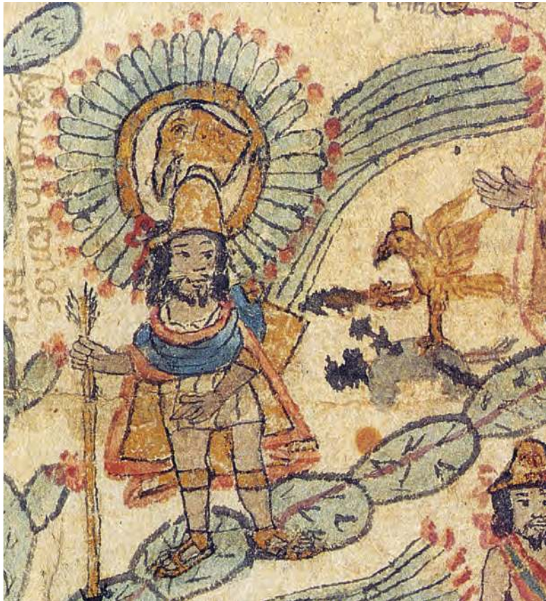
Figura 2.37 Cuauhtémoc fue el último tlatoani mexica. Lo mataron durante la expedición de Cortés a las Hibueras (Honduras), en el año 7 calli (casa); es decir, en 1525, quizá el 28 de febrero. Códice García Granados o Techialoyan (siglo XVII).