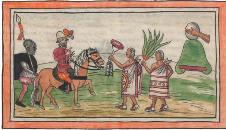
Figura 2.33 Los tlaxcaltecas, enemigos de los mexicas, al principio se enfrentaron con los españoles y a sus aliados totonacas. Tras ser derrotados, decidieron aliarse con ellos. Diego Durán (1579).