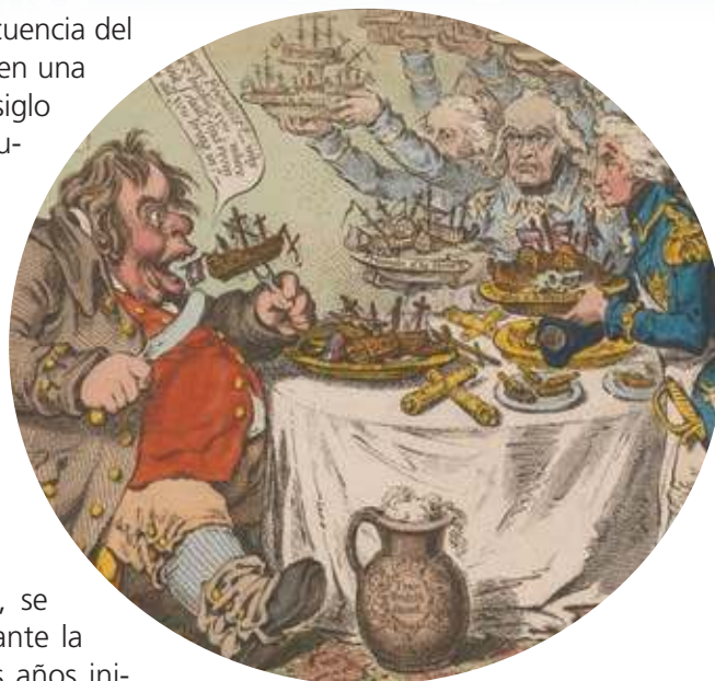
Figura 2.21 El personaje de John Bull se usaba como una representación satírica del Reino Unido. John Bull tomando un almuerzo , James Gilray (1798).

El imperialismo también llegó a Asia (mapa 2.5) y a América. En algunos casos adoptó formas como el protectorado o las zonas de influencia en las que se mantenían las autoridades locales y ciertas formas de organización política.