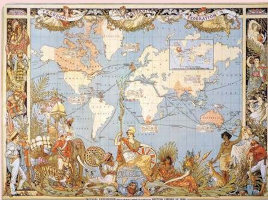
Figura 2.20 Federación Imperial, mapa del mundo que muestra la extensión del Imperio Británico en 1886, John Charles Ready (1886).