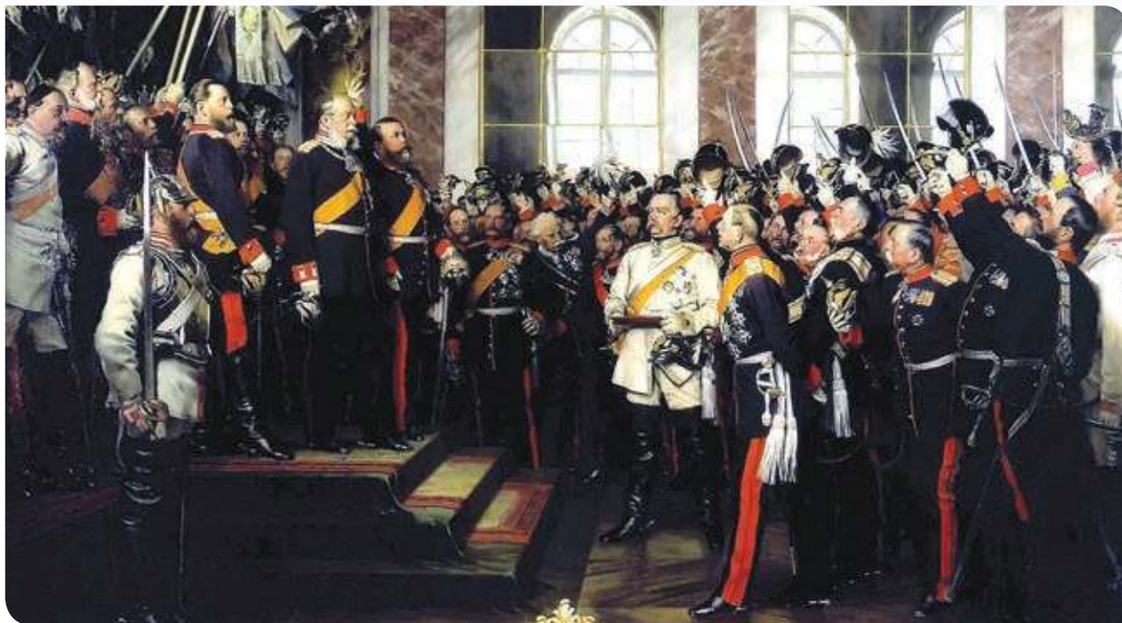
Figura 2.19 En el Palacio de Versalles, Guillermo I proclama el surgimiento de Alemania, en 1871. A partir de entonces, la rivalidad de la nueva nación con Francia fue en aumento hasta que estalló la Primera Guerra Mundial en 1914. La proclamación del Imperio Alemán , Anton von Werner (1885).