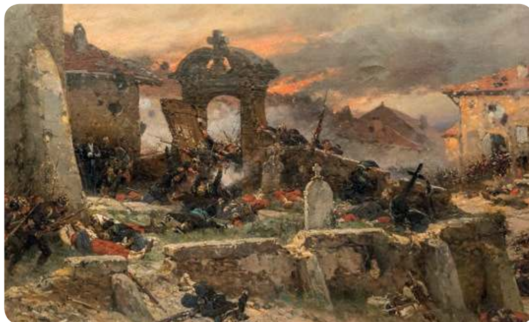
Figura 2.18 La guerra franco-prusiana ocasionó una rivalidad que duró mucho tiempo entre Francia y Alemania. El cementerio de Saint-Privat , Alphonse Marie Adolphe de Neuville (1881).

El acontecimiento que marcó de manera definitiva la unificación alemana fue la guerra franco-prusiana (1870-1871), en la que los germanos utilizaron el ferrocarril para movilizar más rápido a sus tropas (figura 2.18).