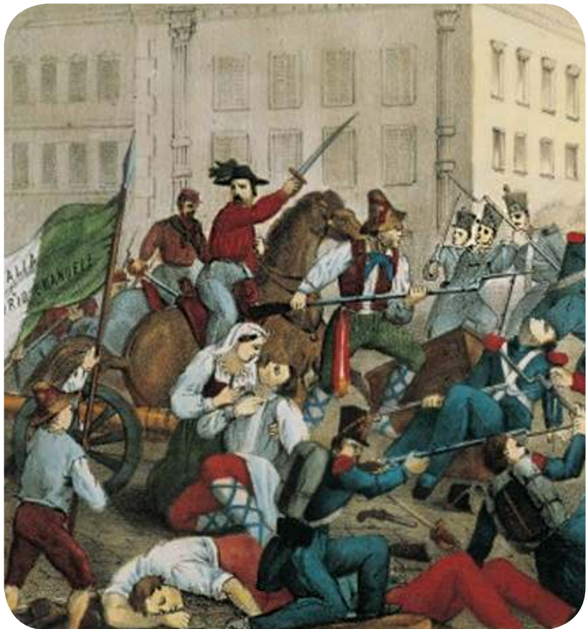
Figura 2.17 A los voluntarios que se unían al ejército de Garibaldi se les conocía como los camisas rojas. Giuseppe Garibaldi entra en Palermo el 27 de mayo de 1860.

Tras un largo y difícil proceso, se concretó la unidad de Italia en 1870 bajo la dirección del rey del Piamonte, Víctor Manuel II y Camilo di Cavour, su ministro. Italia fue declarada monarquía constitucional.