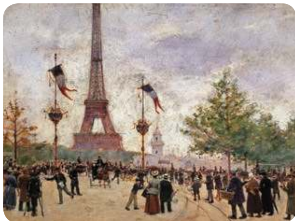
Figura 2.12 La Exposición Universal de París, en 1889, celebró los 100 años de la Revolución Francesa. Esta feria sorprendió por la gran cantidad de máquinas y edificios que resaltaban los avances tecnológicos.