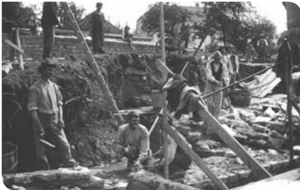
Figura 2.7 Muchos pobladores del campo migraron a las ciudades para trabajar no sólo en las fábricas, sino en diversas obras públicas.