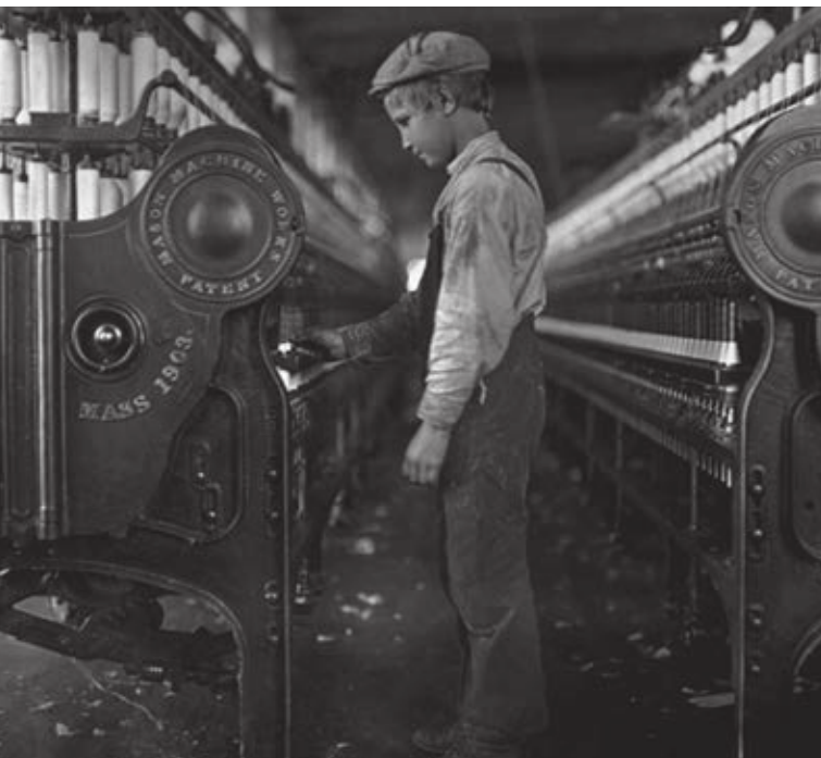
Figura 2.5 Debido a que había pocas leyes que regularan el trabajo, en las industrias trabajaban muchos niños y niñas que cubrían jornadas de hasta 16 horas.

Los productos hechos manualmente decayeron y ya sólo se comercializaban localmente. En cambio, en las grandes fábricas aumentó el ritmo de trabajo y la producción en serie de mercancías comenzó a dominar los mercados urbanos e internacionales. Esta forma de producción fortaleció la nueva organización laboral que desplazó a los artesanos y los sustituyó por obreros (trabajadores asalariados). Los obreros (hombres, mujeres y niños) trabajaban largas jornadas en malas condiciones de higiene y con bajos salarios, además no contaban con leyes que los protegieran. Debido a esto comenzaron a reunirse y formar sindicatos para exigir mejores condiciones de trabajo y la reducción de la jornada laboral (figura 2.5).