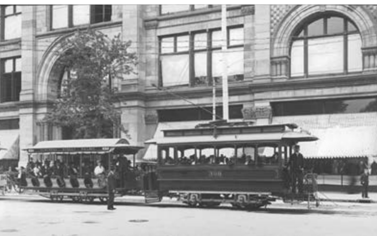
Figura 2.8 La modernización en los sistemas de transporte a finales del siglo XIX se experimentó en diversos lugares del mundo, sobre todo en las grandes ciudades, por ejemplo, los tranvías eléctricos.