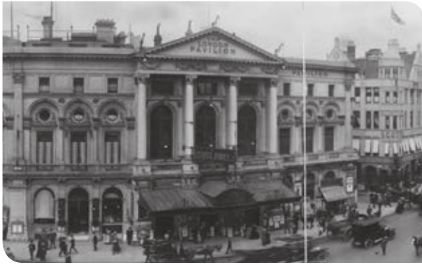
Figura 2.6 Para principios del siglo XIX, la ciudad de Londres era una gran urbe.