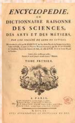
Figura 1.48 La Enciclopedia de Diderot, edición publicada en 1751.