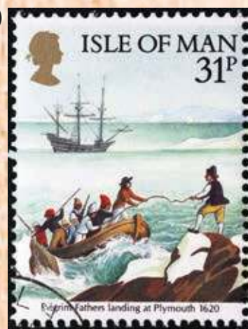
Figura 1.49 Timbre postal de 1986 donde se muestra a los Padres Peregrinos desembarcando en Norteamérica.