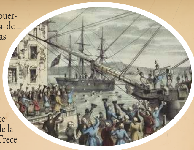
Figura 1.21 Los colonos manifiestan su descontento con la Corona inglesa. La destrucción del té en el puerto de Boston, 1773, Nathaniel Currier (1846).