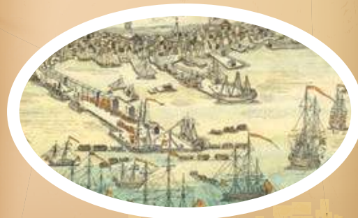
Figura 1.8 Los colonos debían pagar impuestos a las tropas inglesas. Desembarco de las tropas británicas en Boston, Paul Revere (1768).

Monarquía vs. colonos. Al igual que otros reinos del periodo, la monarquía inglesa intentó ejercer mayor control sobre sus colonias para incrementar los beneficios económicos. Por esta razón no vio con buenos ojos la actitud rebelde de los colonos americanos. Una de sus respuestas fue enviar tropas a América (figura 1.8).