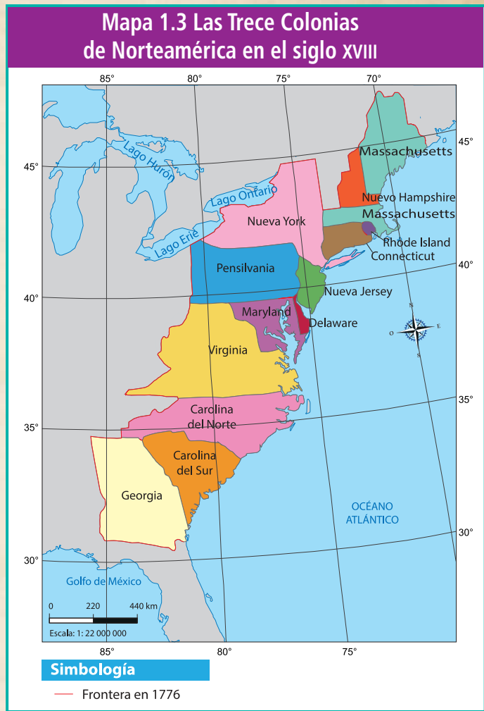
Mapa 1.3 Las Trece Colonias de Norteamérica en el siglo XVIII