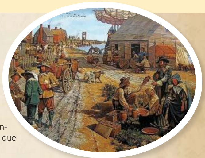
Figura 1.7 La vida en las ciudades coloniales estuvo marcada por la cultura inglesa y la actividad comercial.

En este bloque investigarás acerca de la Independencia de las Trece Colonias de Norteamérica, proceso que dio origen a Estados Unidos.