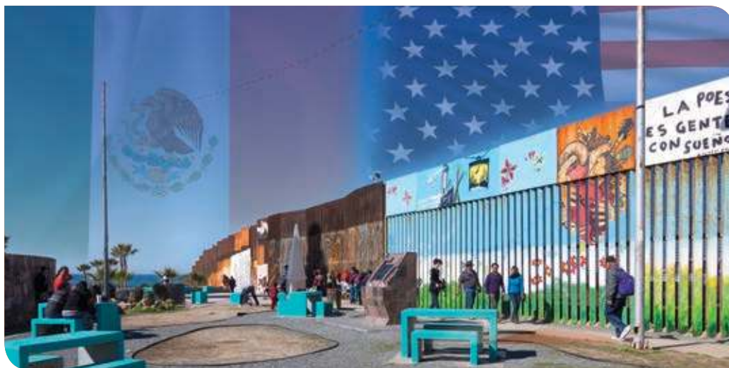
Figura 3.33 Cada mes de abril, desde 1979, en la frontera entre Naco, Sonora, y Naco, Arizona, se lleva a cabo la fiesta binacional.