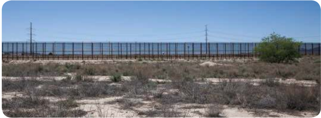
Figura 3.34 Tanto la frontera norte como la frontera sur de México representan un gran reto en las relaciones con los países vecinos y un compromiso social con los migrantes.

A través del recurso audiovisual Fronteras en la actualidad aprenderás acerca de los límites fronterizos, las regiones y las zonas de frontera relacionadas con México.