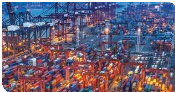
Figura 3.27 Según la Organización Mundial de Comercio, en 2014 las exportaciones mundiales de mercancías alcanzaron los diecinueve mil billones de dólares.

La globalización ha dejado su huella en hogares de los cinco continentes. Si revisas detenidamente dónde fue elaborado algún bien electrónico que utilizas en casa, el calzado o la ropa que usas, los alimentos, un celular o una computadora de la escuela, te darás