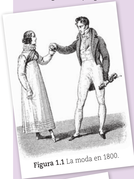
Figura 1.1 La moda en 1800.

2. Escriban una conclusión sobre la importancia del vestido como testimonio para la historia.