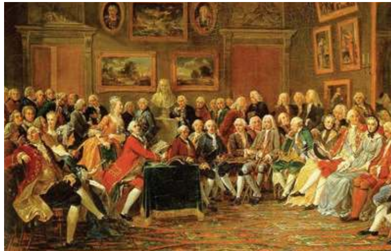
Figura 1.5 Las tertulias fueron espacios de socialización comunes durante el siglo XVIII y eran aprovechadas para compartir las nuevas ideas. Lectura de la tragedia del orfelinato de la China, de Voltaire, en el salón de madame Geoffrin , Gabriel Lemonnier (1812).

Estamentos. Divisiones de una sociedad jerarquizada, cada una cumplía con una función acorde a leyes o a las costumbres.