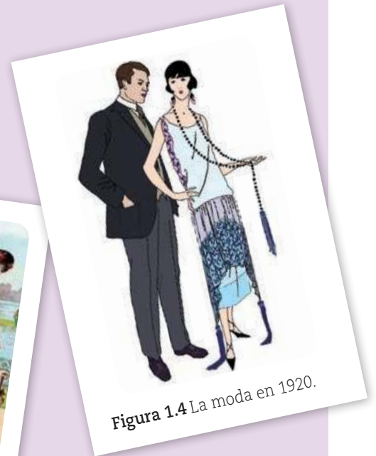
Figura 1.4 La moda en 1920.

En esta sección conocerás los principales procesos y acontecimientos mundiales ocurridos entre mediados del siglo XVIII y mediados del siglo XX, mismos que estudiarás durante los dos primeros bloques del curso.