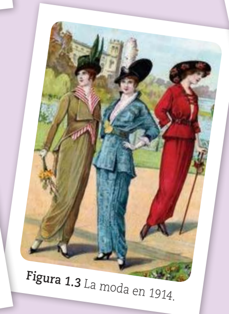
Figura 1.3 La moda en 1914.