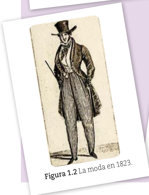
Figura 1.2 La moda en 1823.