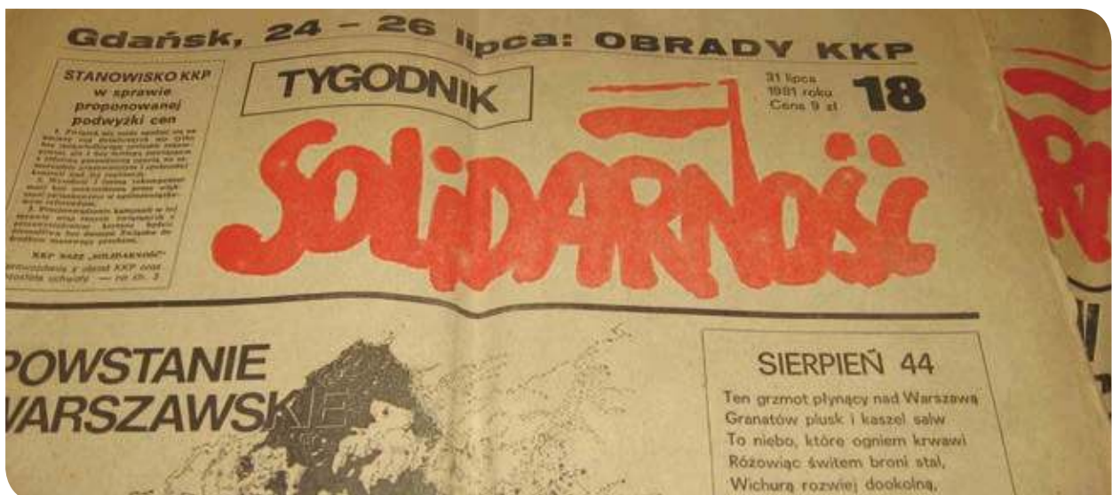
Figura 3.26 El semanario Solidaridad comenzó a circular en los astilleros del puerto de Gdansk (1981).