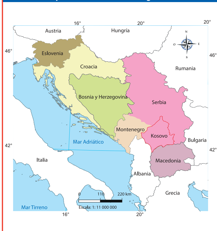
Mapa 3.10 Disolución de Yugoslavia