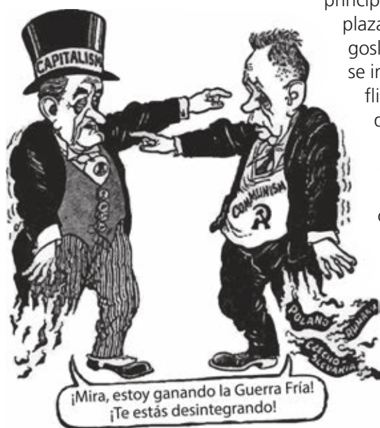
Figura 3.25 Esta caricatura representa la crisis de los bloques al acercarse el fin del mundo bipolar (1968).

La apertura democrática no fue un proceso exclusivo de los países de Europa del Este, también tuvo avances importantes en América Latina, donde hubo cambios de gobierno y se derrocaron varias dictaduras.