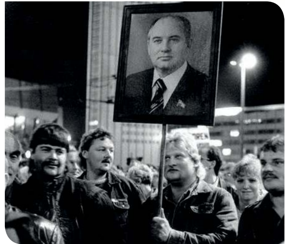
Figura 3.24 Manifestantes llevan una foto del líder soviético Mijaíl Gorbachov en Leipzig el 23 de octubre de 1989.

Ante la falta de confianza en el socialismo y el descontrol de las autoridades en la implementación de las reformas de la perestroika y la glasnost, se produjo el desmembramiento de la antigua potencia (figura 3.24). La mayoría de las repúblicas que integraban la Unión Soviética (Rusia, Ucrania, Bielorrusia, Georgia, Azerbaiyán, Armenia, Uzbekistán, Turkmenistán, Kirguistán, Tayikistán, Kazajistán, Moldavia, Lituania, Letonia y Estonia) aprovechó la situación para buscar su independencia. En esas repúblicas se desarrollaron movimientos nacionalistas que pretendían la separación e impulsar procesos democráticos.