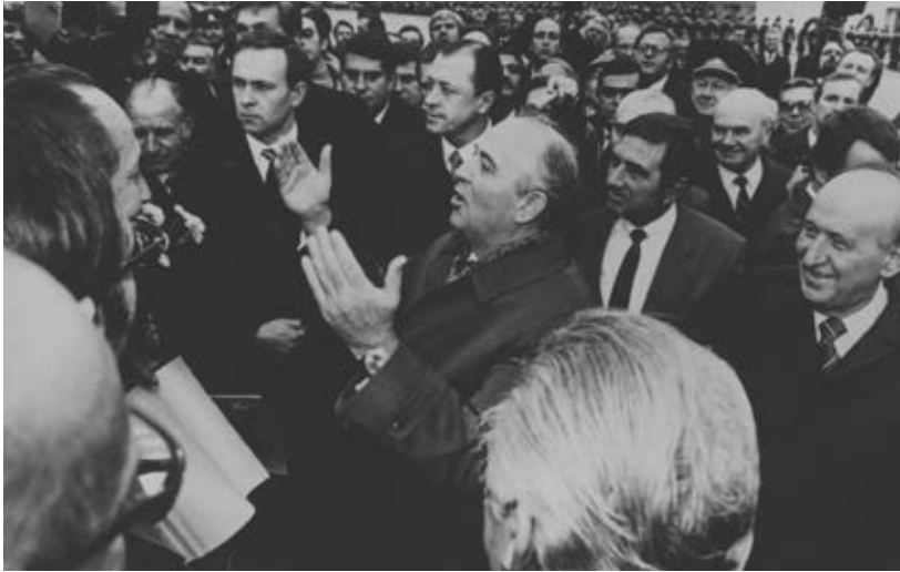
Figura 3.20 Mijaíl Gorbachov ante una multitud en las calles de Moscú.

colapsaron y ocasionaron una baja en el nivel de vida de la población. Si a esto se le agrega la pérdida del control político del partido único que gobernaba la Unión Soviética por la aplicación de las reformas democratizadoras de la glasnost, el resultado fue el rápido derrumbe de esta potencia.