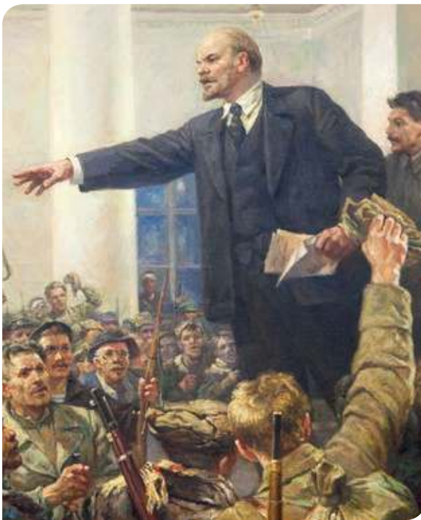
Figura 3.14 El arte oficial soviético tenía un estilo realista que buscaba exaltar los valores de los trabajadores y el optimismo en el futuro. Lenin habla de la revolución (1917).