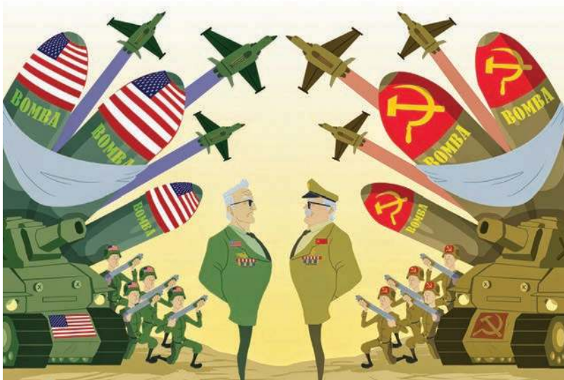
Figura 3.12 Esta caricatura representa la división bipolar del mundo durante la Guerra Fría.