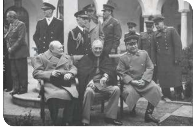
Figura 3.11 En 1945, los líderes de los países vencedores se reunieron en Yalta para determinar el futuro de Europa: Churchill (Reino Unido), Roosevelt (EUA) y Stalin (URSS).

El primer conflicto entre ambas naciones surgió por la división del territorio alemán en cuatro, cada uno administrado por uno de los países vencedores: URSS, Estados Unidos, Francia y el Reino Unido (mapa 3.2). En 1949 ese territorio fue redistribuido y se fundaron dos repúblicas: la República Federal Alemana, bajo la influencia estadounidense, británica y francesa, y la República Democrática Alemana, dominada por los soviéticos.