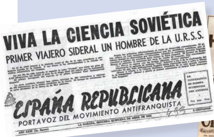
Figura 3.9 En 1961, el astronauta soviético Yuri Gagarin fue el primer ser humano en ser lanzado al espacio.