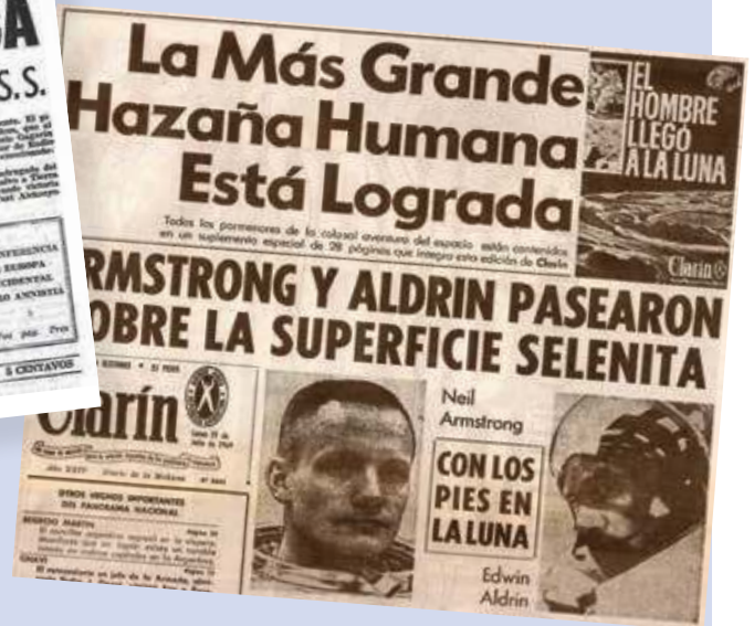
Figura 3.10 En 1969, la tripulación de la misión estadounidense Apolo 11 llegó a la Luna.