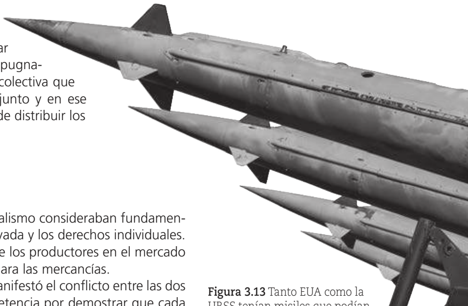
Figura 3.13 Tanto EUA como la URSS tenían misiles que podían recorrer miles de kilómetros.

Uno de los frentes en donde se manifestó el conflicto entre las dos grandes potencias fue el de la competencia por demostrar que cada uno poseía el mayor desarrollo tecnológico y militar (figura 3.13).