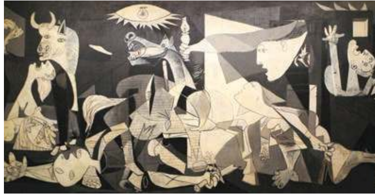
Figura 2.40 El Guernica , 1937. Pablo Picasso pintó este mural para dejar constancia del bombardeo que ordenó Franco sobre esta ciudad española el 26 de abril de ese año.

Con esto inició la Guerra Civil Española, un enfrentamiento entre dos grandes bandos que involucró a la opinión pública mundial. Por un lado, estaba el gobierno republicano que recibió el apoyo decisivo de México y la Unión Soviética; por otro, Alemania e Italia apoyaron a los sublevados, lo que sirvió para probar nuevo armamento y tácticas de guerra, como el bombardeo de ciudades para amedrentar a la población (figura 2.40).