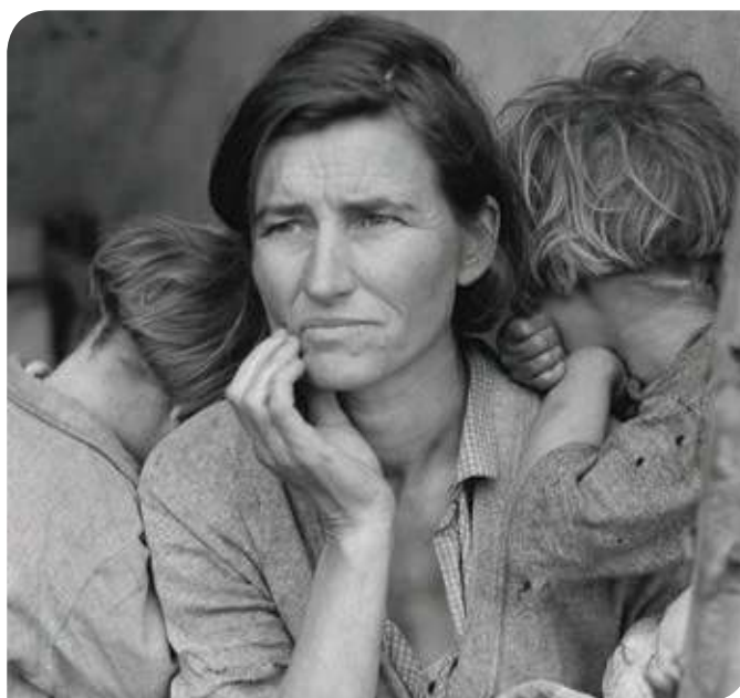
Figura 2.39 Durante la Gran Depresión, las mujeres y los niños fueron especialmente afectados por la escasez de alimentos.

Especulación. Conjunto de operaciones comerciales o financieras cuyo objetivo es obtener un beneficio económico al invertir dinero en productos o servicios a bajo costo y aprovechar el cambio de precios para poder revender a un mayor precio.