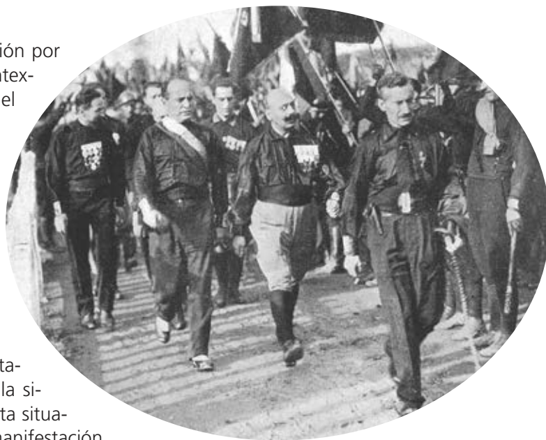
Figura 2.37 Benito Mussolini al frente de los Camisas Negras en Bolonia durante la Marcha sobre Roma, 1922.

Italia era una monarquía parlamentaria que se encontraba debilitada por la situación social. Mussolini aprovechó esta situación para emprender en 1922 una manifestación de Nápoles a Roma, conocida como Marcha sobre Roma (figura 2.37).