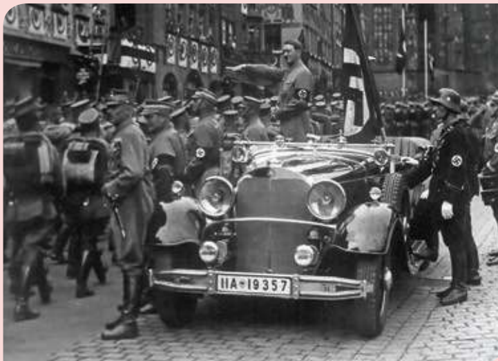
Figura 2.36 Desfile nazi en Núremberg, Alemania.