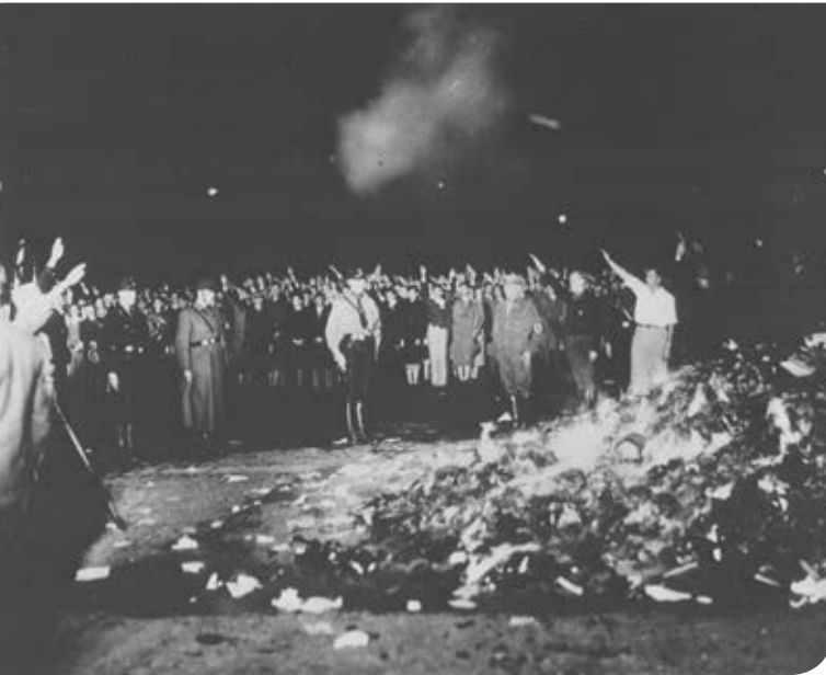
Figura 2.38 La quema de libros fue una forma de perseguir las ideas contrarias al régimen nazi.

El fascismo italiano exaltaba el orgullo nacional, que en este caso remitía a la grandeza del Imperio romano, del cual adoptó muchos símbolos, como el saludo con el brazo extendido y el haz de flechas de la Roma antigua, llamado fascio , que resaltaba la liga o unión entre los integrantes de la sociedad. Estos símbolos promovieron que un sector muy amplio de la población se identificara con el fascismo.