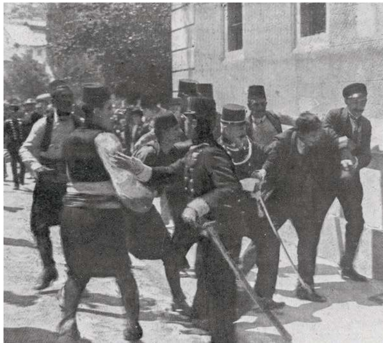
Figura 2.23 Momento en que es arrestado Gavrilo Princip, miembro del movimiento nacionalista “Joven Bosnia”, después de asesinar al archiduque Francisco Fernando y a su esposa Sofía Chotek en Sarajevo.

Alemania cruzó la frontera franco-belga en agosto de 1914, con lo cual esperaba dominar rápidamente el Frente Occidental, es decir, intentaba someter a Francia tal como lo había hecho casi cincuenta años antes. Pero su avance se detuvo a menos de 40 kilómetros de París en septiembre, cuando ocurrió la batalla del Marne. En aquella batalla intervinieron casi dos millones de hombres. Fue la primera contienda masiva, en la cual se movilizaron tantos soldados. Tal fue una de las características de esta guerra: mandar miles de combatientes al frente. Después de esta batalla, en el Frente Occidental, el conflicto entró en la fase de la guerra de trincheras que duró casi tres años, hasta 1917.