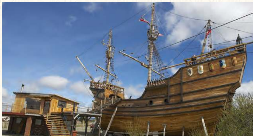
Figura 1.21 Réplica de la nao Victoria, en Punta Arenas, Chile. Fue el primer buque europeo que circunnavegó el globo terrestre. Perteneció a la Armada de la especiería comandada por Fernando de Magallanes.

Grandes viajeros han existido a lo largo de la historia. En la narrativa Ulises es el más grande y memorable, Simbad el marino no se queda lejos, pero en la vida real hay otros ejemplos. En el siglo xiv, antes de que los exploradores portugueses y españoles llegaran a las tierras que hoy conocemos con el nombre de continente americano , un árabe llamado Ibn Battuta hizo un viaje de 23 años que abarcó parte de África, Europa y Asia. El testimonio de su viaje está al alcance de los lectores y lleva por nombre A través del Islam .