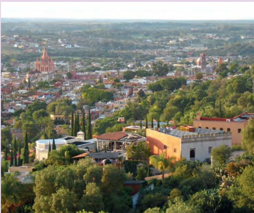
Figura 1.20 Fotografía aérea de la ciudad de San Miguel de Allende, Guanajuato, tomada con un dron.

El lenguaje cartográfico permite desarrollar nuestra curiosidad; proponer la solución a problemas naturales, sociales, económicos y políticos de nuestro espacio geográfico; idear propuestas de prevención a problemas; relacionar la información cartográfica con la realidad; localizar la información necesaria para transformarla en un conocimiento útil y crítico que pueda emplearse en la vida cotidiana.