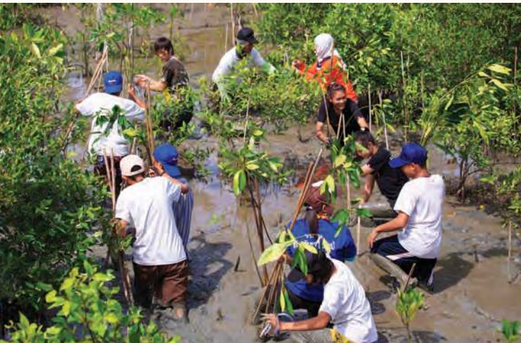
Figura 3.26 Hay muchas formas en las que podemos contribuir con el cuidado del ambiente, por ejemplo, estos voluntarios de Tailandia participan en la reforestación de manglares.

En la actualidad, algunas de las actividades que no cumplen con los principios de sustentabilidad van en aumento; por ejemplo, uso desmedido del automóvil, producción excesiva de mercancías que no son de primera necesidad, uso inmoderado del agua al bañarse, en las labores de limpieza del hogar o en fábricas, industrias muy contaminantes, actividades turísticas agresivas con el ambiente y un alto consumo de productos desechables, entre otros.