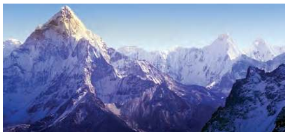
Cordillera de los Himalaya, Asia

Desde el aspecto geográfico, el territorio es el espacio terrestre delimitado políticamente y dividido en términos político-administrativos, como los países, estados o municipios. Es el espacio considerado en sus relaciones con los pueblos que lo ocupan, lo administran y lo gobiernan.