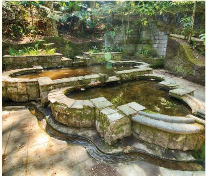
Figura 1.11 Parque Los Tecajetes en Xalapa, Veracruz.

Sólo hace falta recorrerlo para sentir ese aire lleno de vida; la calidez del lugar no sólo se hace presente por el clima, sino por la gente de Xalapa que siempre te regala una sonrisa.