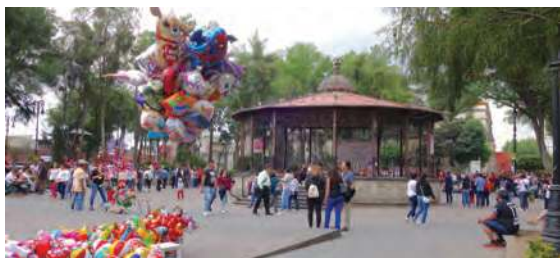
Barrio de Coyoacán, Ciudad de México

La región es un espacio terrestre con características naturales, sociales, culturales y económicas semejantes que le dan identidad y la diferencian de otras; puede ser grande como la selva del Amazonas, las Rocallosas o los Andes, o pequeña como la región carbonífera de Coahuila.