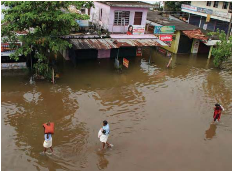
Figura 1.10 Kuttanad, India, es una población ubicada a nivel del mar que sufre inundaciones fuertes en la temporada de lluvias.

diversidad de las actividades económicas, las manifestaciones culturales, las construcciones y la forma en que se delimitan políticamente los espacios, ya sea la localidad, la entidad o el país.