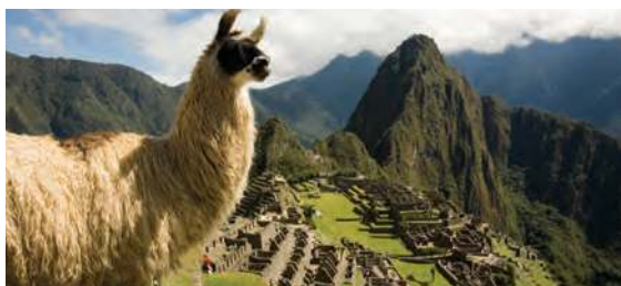
Machu Picchu, Perú

La región es un espacio terrestre con características naturales, sociales, culturales y económicas semejantes que le dan identidad y la diferencian de otras; puede ser grande como la selva del Amazonas, las Rocallosas o los Andes, o pequeña como la región carbonífera de Coahuila.