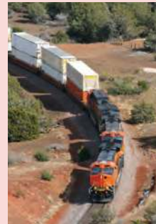
Figura 2.53 Distintos tipos de transporte: terrestre, marítimo, aéreo y ferroviario.

En esta lección conocerás la función de las redes de comunicaciones y transportes en la interdependencia económica entre países. Al final elaborarás un mapa y una infografía sobre las redes de comunicaciones y transportes del mundo.