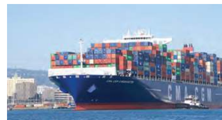
Figura 2.54 Asia lidera a nivel mundial el volumen de movimiento de contenedores. Siete de los diez principales puertos del mundo se encuentran en China.

En la actualidad es la base del comercio internacional y representa 90% de los envíos a escala mundial. Es una forma ecológica de transporte, si lo comparamos con los autobuses o los aviones. Se concentra en las denominadas rutas marítimas, que son las trayectorias de paso obligatorio entre océanos y mares (figura 2.54). Las cuatro rutas marítimas más importantes son el estrecho de Malaca, que conecta al océano Índico con el mar del Sur de China, y a través del cual circulan alrededor de 50 mil naves por año, lo que representa 30% del comercio marítimo global (incluye 80% de petróleo que se distribuye a China,