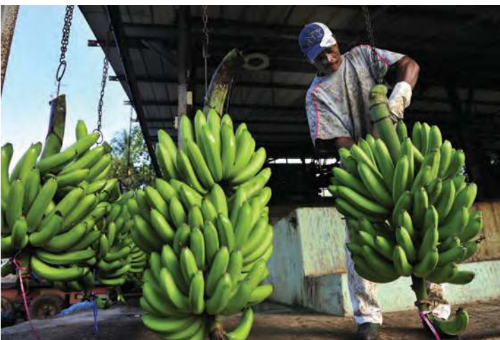
Figura 2.51 Los países más ricos e industrializados se especializan en la producción y comercialización de productos de alto valor tecnológico (arriba), mientras que los países más pobres participan en el comercio internacional con productos del sector primario que tienen poco valor añadido en el mercado (abajo).

Cada país participa de forma diferente en el comercio internacional debido sobre todo a sus distintos niveles de desarrollo y a factores como las condiciones climáticas, los recursos naturales y el nivel de avance tecnológico con que cuentan (figura 2.51). Por ejemplo, los países tropicales producen y comercializan productos como café y azúcar, mientras que los de clima templado producen cereales como trigo y maíz; por su parte, los países con playas y temperaturas cálidas cuentan con un desarrollo turístico importante.