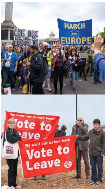
Figura 2.50 En la actualidad la Unión Europea está compuesta por 28 países; sin embargo, desde que Reino Unido anunció que dejaría de ser parte de dicha organización, fenómeno que se conoce como Brexit, ha habido múltiples manifestaciones a favor y en contra de la medida.