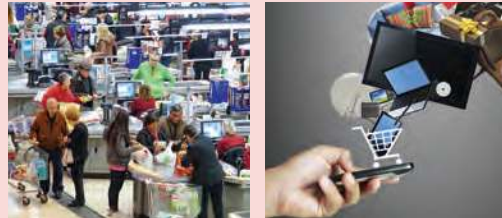
Figura 2.49 Dos formas de comprar mercancías.

En esta lección analizarás la importancia del comercio en las relaciones económicas entre países.