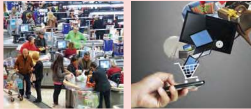
Figura 2.49 Dos formas de comprar mercancías.

En esta lección analizarás la importancia del comercio en las relaciones económicas entre países.